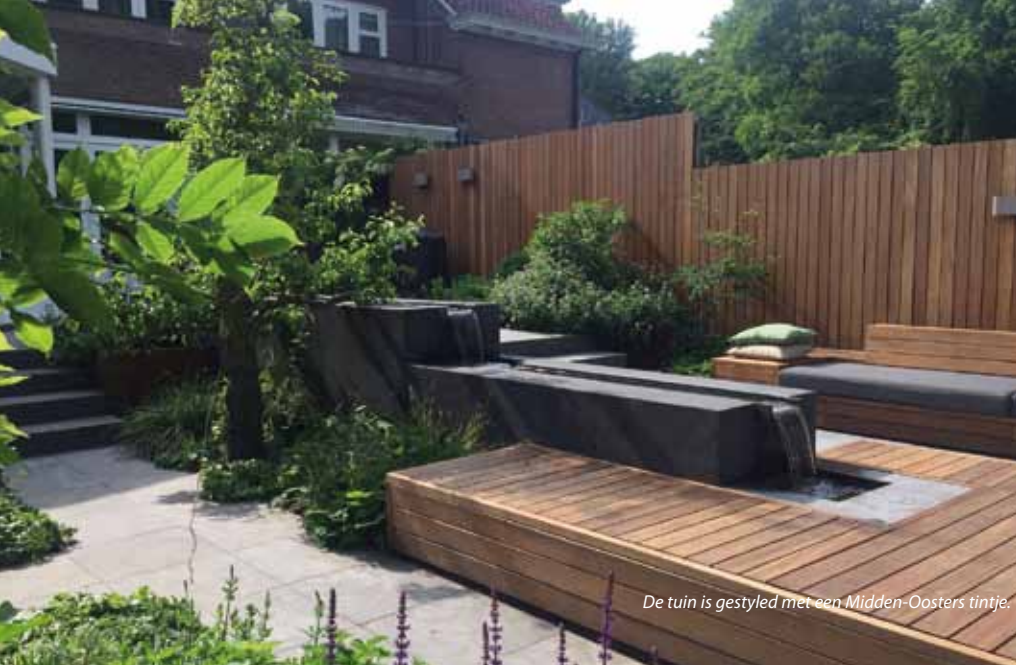
De tuin is gestyled met een Midden-Oosters tintje.